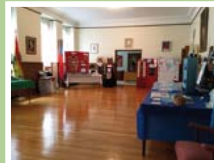
Blick in den „Heritage Walk“

Auch Begegnungen, fröhliches Singen und Feiern in der Gemeinschaft fanden ihren guten Platz und trugen wesentlich zum Gelingen dieser Tage bei.