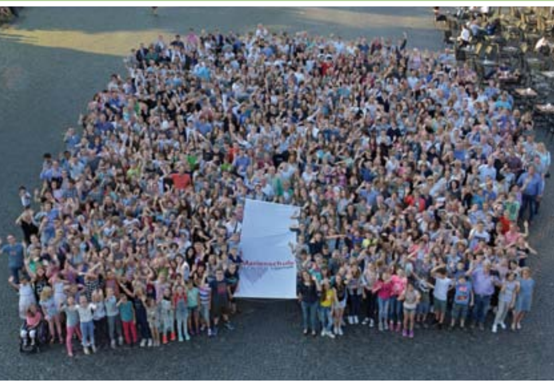
Vor dem Lippstädter Rathaus erschallt aus 1000 Kehlen: „Happy Birthday, Pauline!“

vor nunmehr 120 Jahren, Die Einweihung des neuen Schulgebäudes mit Schwesternhaus, Kapelle und Internat in Lipperbruch, vor 50 Jahren, Den 200. Geburtstag der Seligen Pauline von Mallinckrodt, deren Kongregation nach gewaltsamem Weggang der Heiligenstädter Schulschwestern im Jahre 1938 dann nach Kriegsende im Jahr 1945