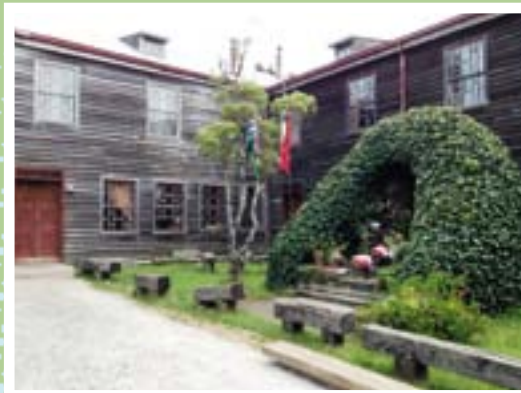
Teil des ersten Mutterhauses und Kirche in Ancud.

sionsstation unserer Schwestern in Ancud, im Süden Chiles geplant. Von den zum Teil weit entfernten Niederlassungen werden Schwestern, Laienmitglieder und Vertretungen aus den Schulen dorthin kommen.