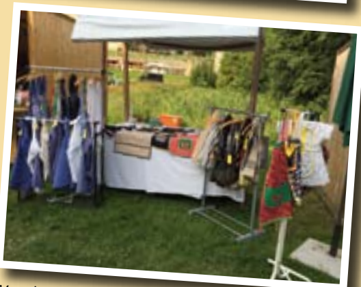
Von den Schürzen, Taschen und Rucksäckchen blieb kaum etwas übrig.