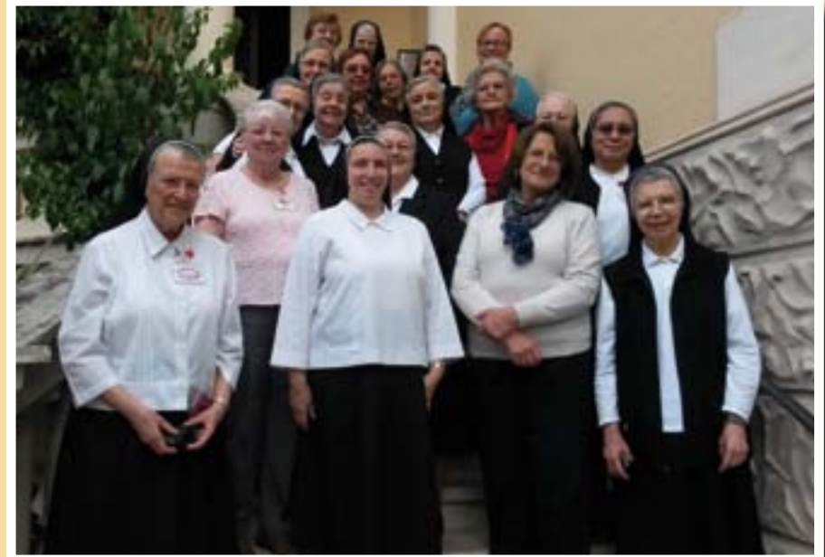
Die Gruppe vor dem Generalat in Rom

Im Verlauf der Woche in Rom hatten wir die Gelegenheit, in einem Statio-Gang von der Engelsburg aus zum Petersdom durch die hl. Pforte zu gehen. Nachdem wir an der Engelsburg das Pilgerkreuz übernommen hatten, zogen wir in einer Prozession mit mehreren Stationen mit Gebeten und Gesängen zum Petersdom. Es war ein beeindruckendes Erlebnis, vor allem für die Teilnehmerinnen, die zum